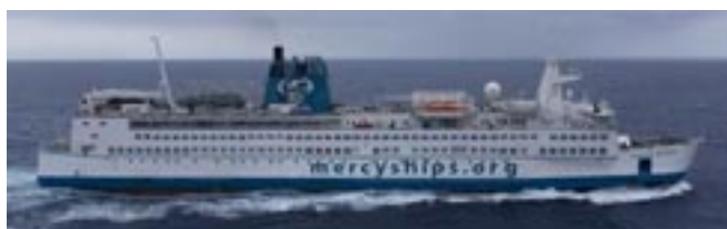
Dronning Ingrid", tidligere Storebæltsfærgen er nu omdøbt til "Africa Mercy"

I skrivende stund er vi blevet vidne til et meningsløst og ondskabsfuldt terrorangreb fra Hamas' side mod uskyldige mennesker i Israel. Her kan man tale om uønsket aktiv "dødshjælp" til mennesker, der ikke havde bedt om at blive frarøvet livet. I mange år frem bliver der brug for aktiv livshjælp til dybt traumatiserede pårørende. Hvordan skal man fastholde troen på det gode i verden og en kærlig Gud i sådan en situation? Ikke desto mindre skal evangeliet om frelse og håb til stadighed forkyndes. At Gud er den, der greb ind med aktiv livshjælp til en fortabt menneskehed, da han sendte sin Søn til jorden julenat. Han, som fortsat giver aktiv livshjælp til alle, der henvender sig til ham i gode såvel som i onde dage. For han er nær hos den enkelte og giver livet værdighed og indhold.